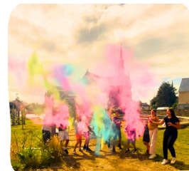
PROGRAMME JEUNESSE ÉTÉ 2026

Système de navettes. Renseignements et inscriptions au 06 32 01 40 82 / 07 86 01 72 33 / accueil@famillesruralesguisseny.fr