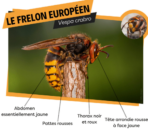
LE FRELON EUROPÉEN Vespa crabro Abdomen essentiellement jaune Pattes rouges Thorax noir et roux Tête arrondie rousse à face jaune